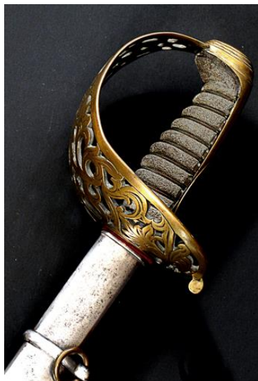
SABLE Oficial Caballería Ligera modelo 1840 Libro ESPADAS ESPAÑOLAS. por Vicente Toledo