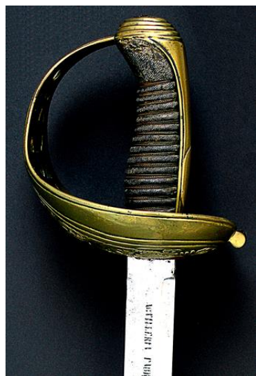
SABLE Oficial Caballería Ligera modelo 1840 Libro ESPADAS ESPAÑOLAS. por Vicente Toledo