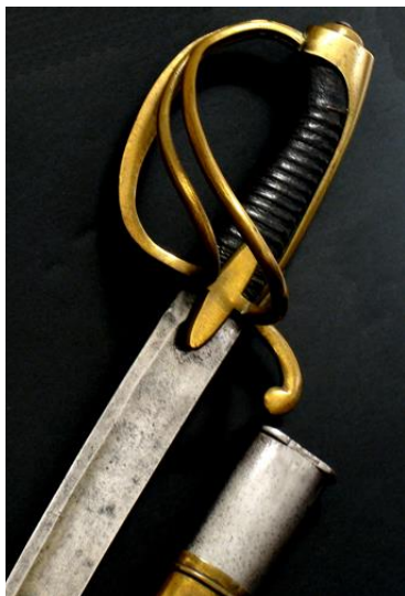
SABLE hacia 1820 Libro ESPADAS ESPAÑOLAS, por Vicente Toledo